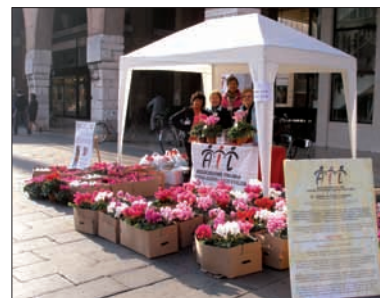
Manifestazione dei fiori dell'AIL a Ferrara (ottobre 2007)