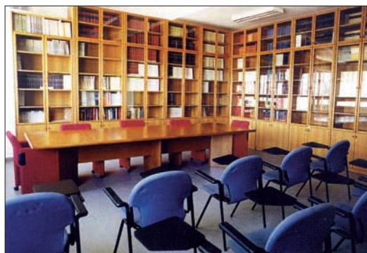
Biblioteca e sala di lettura della nuova sezione di Ematologia.