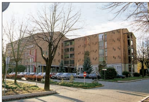
Clinica Medica Generale presso l'Arcispedale S. Anna di Ferrara, sede originaria del primo nucleo della sezione di Ematologia ferrarese.

Parte integrante dell'Istituto è inoltre il Centro della Coagulazione ed emostasi inizialmente strutturato e diretto dal professor