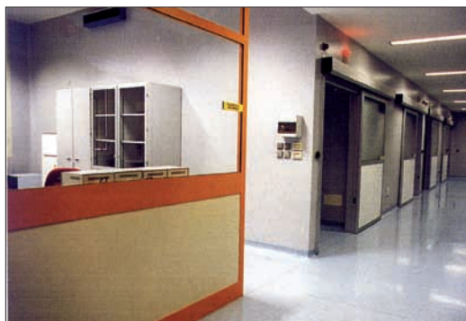
Centro Trapianti annesso alla Degenza della sezione di Ematologia.