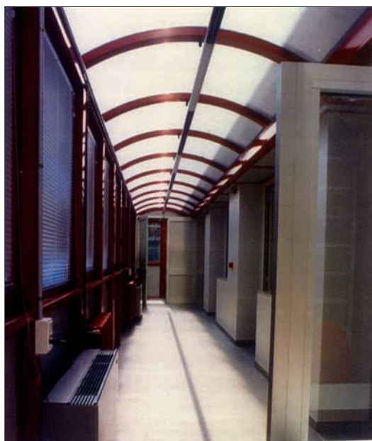
Sequenza degli ambulatori per esterni presso la sezione di Ematologia di Ferrara.